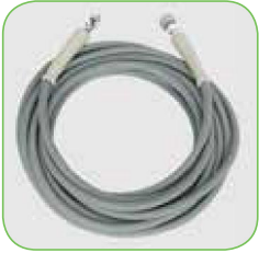
10 m hogedrukslang (3/8")