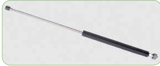
Enkele RVS spuitlans met hogedruksproeier en draaikoppeling.