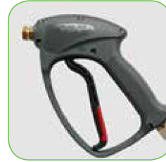
Hogedrukpistool met swivel